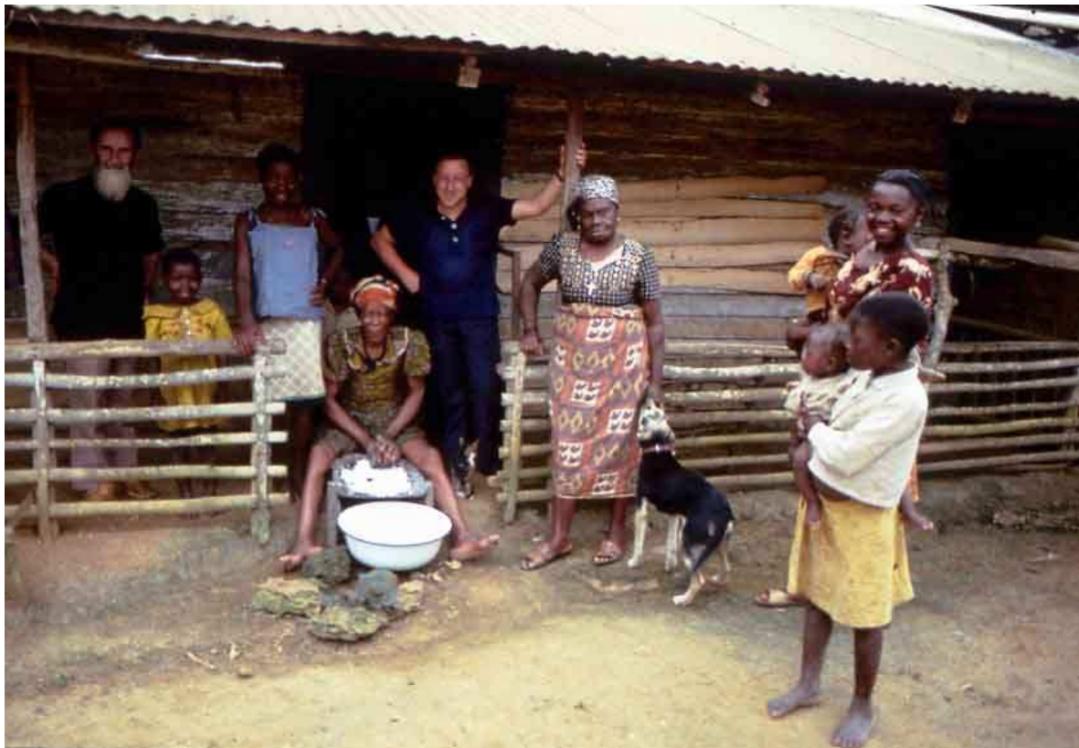
Tipica abitazione di Haiti

A questa situazione sociale ed economica assai sfavorevole, va aggiunto il clima di grande instabilità politica e di violenza che domina il Paese.