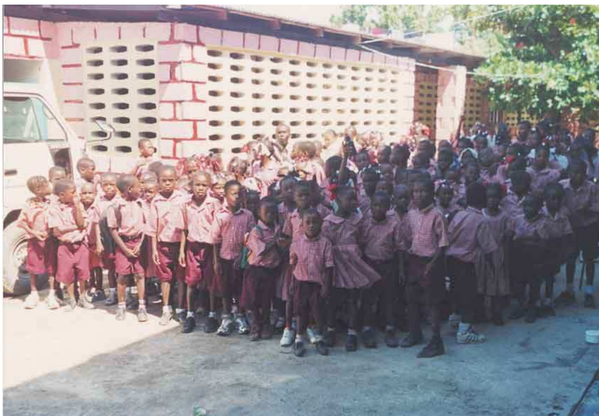
Alcuni bambini della scuola di 'Lakay Mwen

187 bambini dai 6 agli 11 anni e relative famiglie – Il numero degli alunni è destinato ad aumentare in futuro.